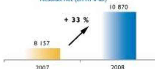
Résultat net (en KMAD)

Le résultat net a connu une hausse notable de 33%, passant ainsi de 8,2 MMAD en 2007 à 10,9 MMAD en 2008. Cette performance est imputable surtout à la progression du résultat opérationnel et dans une moindre mesure à l'amélioration du résultat financier.