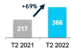
CA consolidé S1 (MDH)