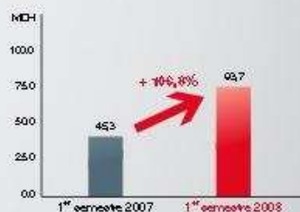
Résultat net part groupe